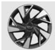
17" Innovation PHEV & Innovation Plus & Executive