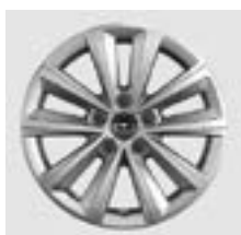
16" Innovation (Ei PHEV)

*Tarkista varusteiden vaikutus auton WLTP-CO 2 -arvoihin opel.fi tai Opel-liikkeestä.