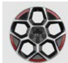
18" GS Line - valinnainen