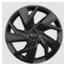
17" GS Line