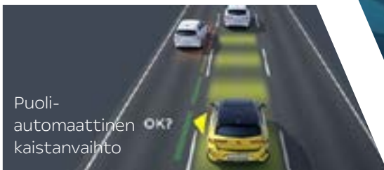
Puoli- automaattinen kaistanvaihto