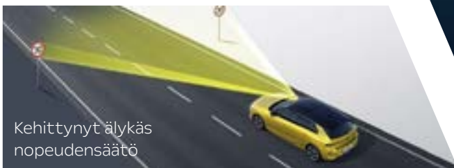
Kehittynyt älykäs nopeudensäätö